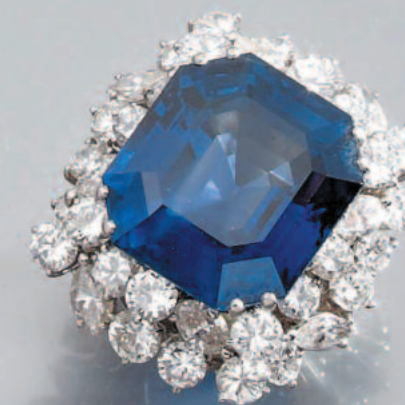
Importante bague sertie d'un saphir birman taille émeraude pesant environ 30 carats Certificat en cours d'élaboration.

Expertises gratuites et confidentielles sur simple rendez-vous