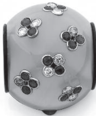
SUZANNE BELPERRON Clip tonneau en agate et pierres précieuses. Vers 1950.