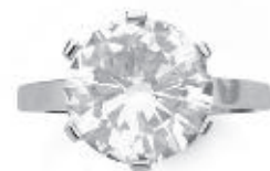
BAGUE en platine sertie d'un diamant rond pesant 5,19 cts.