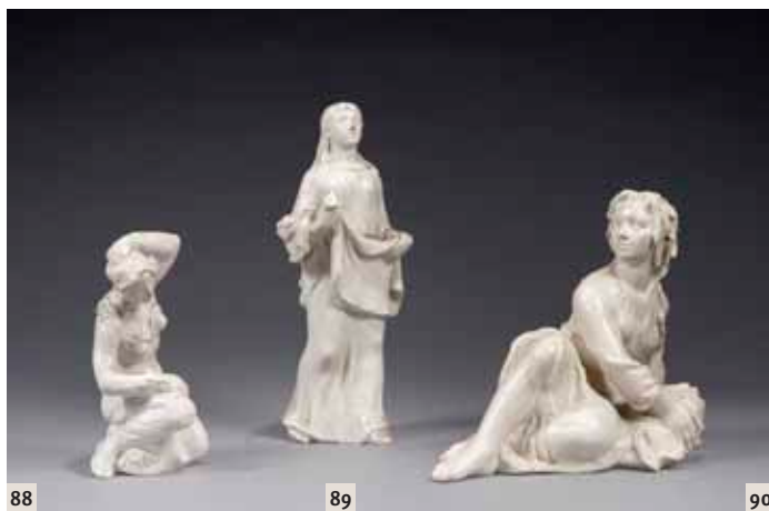
88 Odette Lepeltier Jeune femme, main dans ses cheveux Sculpture en céramique émaillée blanc, signée et datée 57 en-dessous Hauteur: 25,5 cm