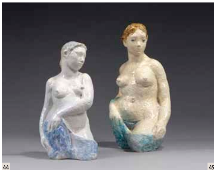
44 Odette Lepeltier Femme, tête tournée vers la gauche Sculpture en céramique émaillée bleu clair Hauteur: 37,5 cm (Défauts de cuisson) 100 / 200 €