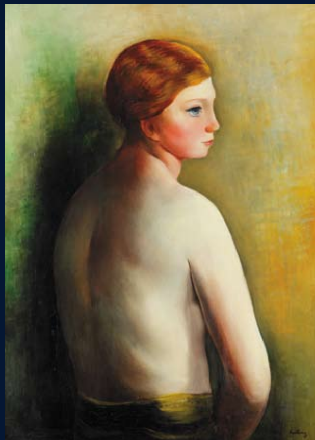
Moise Kisling - Nu de dos - Huile sur toile - 73 x 54 cm - Signé

VENTE EN PRÉPARATION Clôture du catalogue le 12 mars