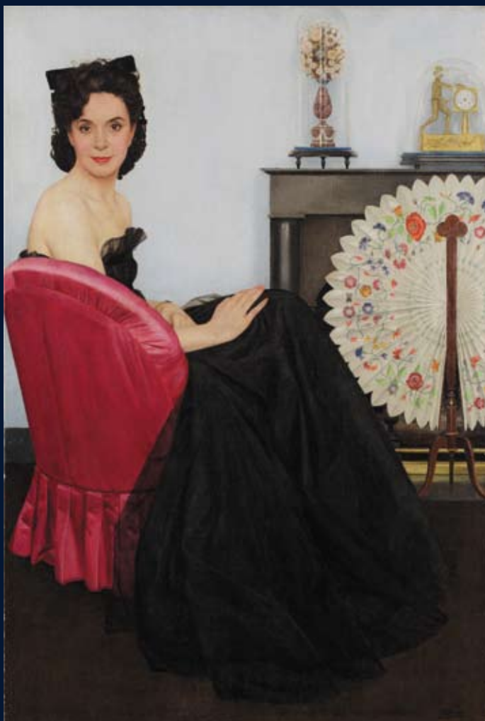
Bernard Boutet de Monvel - Madame de - Huile sur toile - 83 x 56 cm - Signé

Lundi 19 mars 2012- 14h00 Paris – Drouot Richelieu - Salle 5 d'une provenance unique