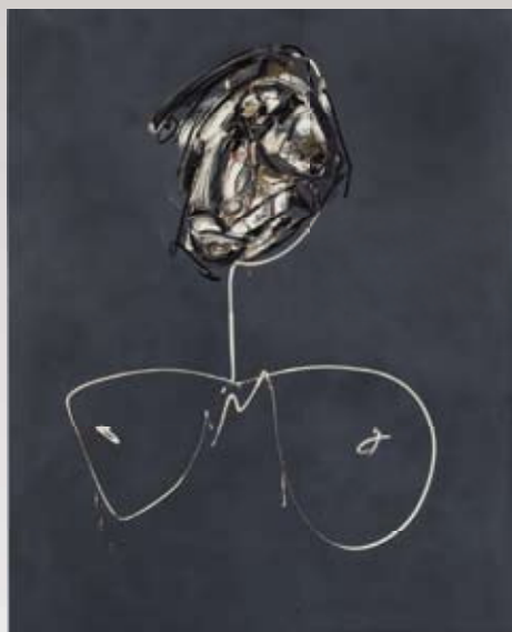
▲ Antonio Saura (1930-1998), Anta , 1961 Huile sur toile signée, datée et titrée sur le châssis 162 x 130 cm