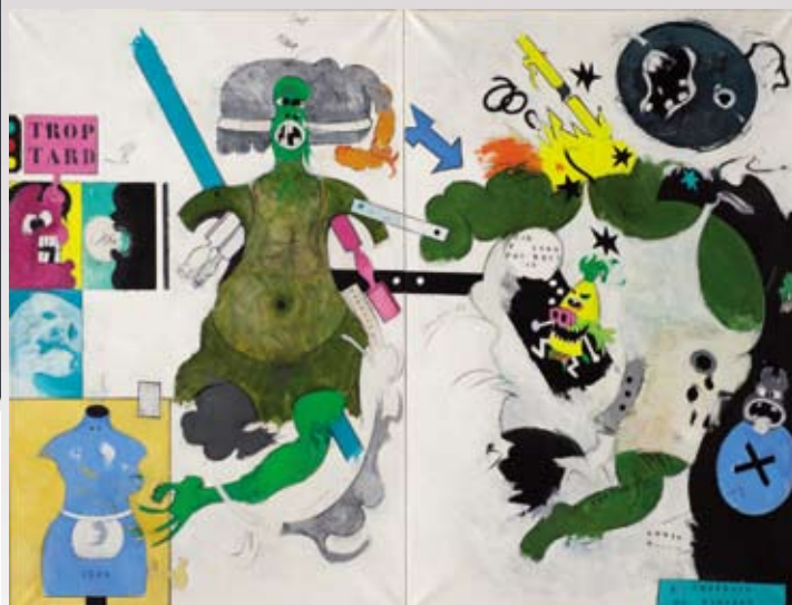
Hervé TÉLÉMAQUE (né en 1937) Portrait de famille , 1962. Huile sur toile signée et datée au centre, contresignée et datée au dos de chaque élément, titré sur le châssis. Diptyque. 195 x 130 cm (chaque) ; 195 x 260 cm (l'ensemble) ▼